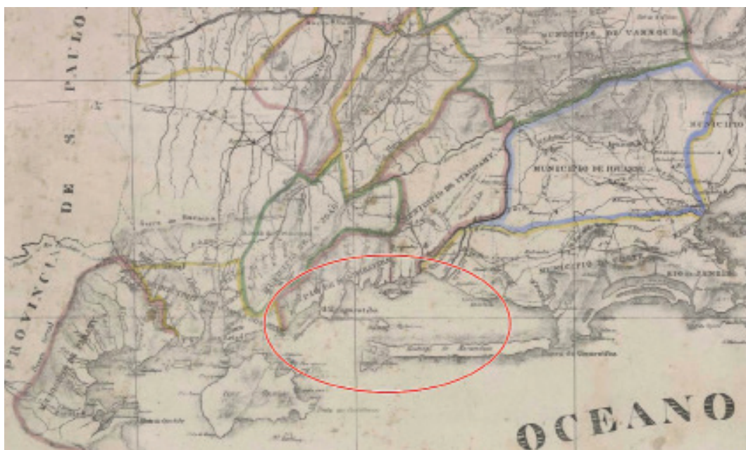
Mapa 1: O Vale do café e o litoral de Mangaratiba.

Fonte: Biblioteca Nacional (BN). Recorte da “Carta corographica da província do Rio de Janeiro, segundo os reconhecimentos feitos por Conrado Jacob Niemeyer (1839)”. Disponível em: < www.bndigital.bn.br >. Acessado em: 2 jun. 2014.